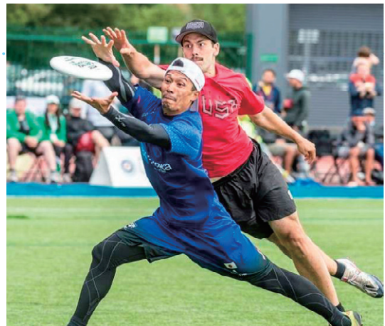
2016ロンドン世界大会

この競技を始めて11年目ですが、大学4年時に初めて日本代表に選ばれ、2016年ロンドンで行われた世界大会では準優勝することができました。現在は、2020年に開催される世界大会で金メダルを取るためにチームの仲間と練習に励んでいます。働きながらもこのような素晴らしい目標に向かうことができる環境を与えてくださっている職場に感謝を忘れず、仕事でも恩返しができるよう日々精進しています。