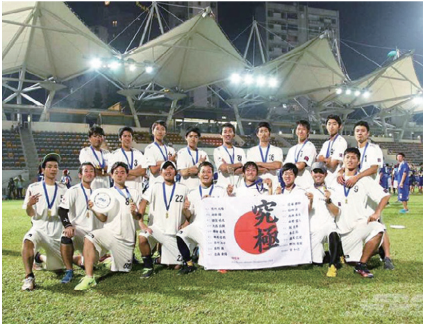
2015アジア大会優勝（本人最右上段）